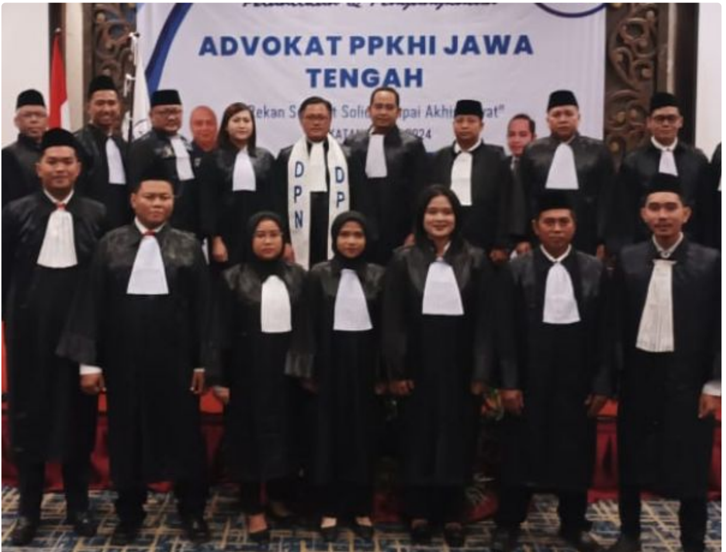
Foto: PPKHI Dewan Pimpinan Daerah (DPD) Jawa Tengah sukses melaksanakan pelantikan dan pengangkatan advokat periode Desember 2024.

KOTA SEMARANG - Perkumpulan Pengacara dan Konsultan Hukum Indonesia (PPKHI) Dewan Pimpinan Daerah (DPD) Jawa Tengah sukses melaksanakan