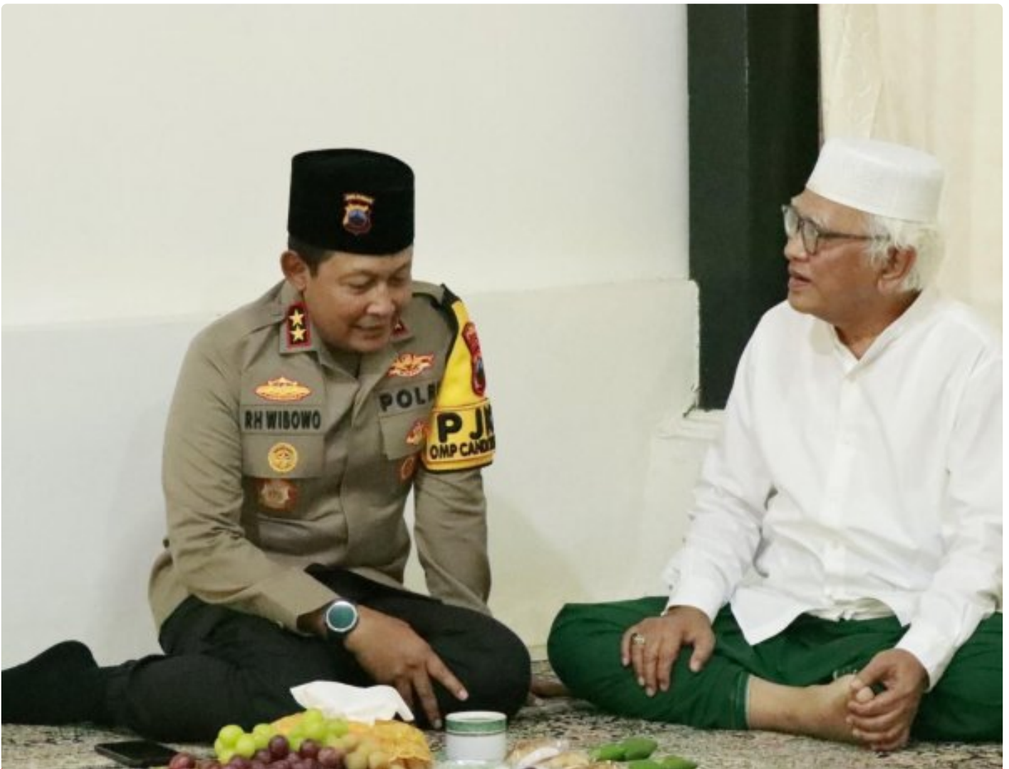
Foto: Kapolda Jawa Tengah, Irjen Pol Ribut Hari Wibowo, melakukan kunjungan silaturahmi ke sejumlah tokoh agama terkemuka di Kabupaten Rembang pada kesempatan menjelang Pilkada 2024. Senin (21/10/2024).

REMBANG- Dalam suasana hangat dan penuh kekeluargaan, Kapolda Jawa Tengah Irjen Pol Ribut Hari Wibowo mengunjungi sejumlah tokoh agama